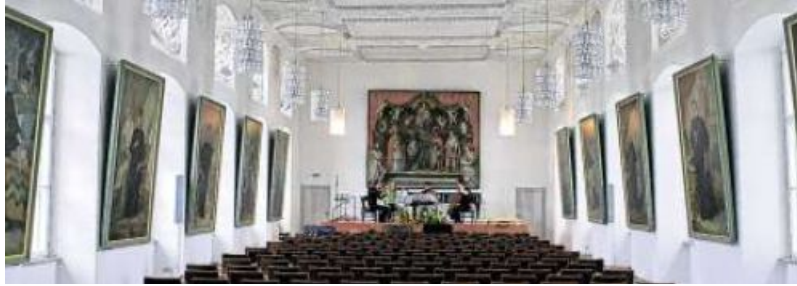
Der Fürstensaal in der Residenz wird wieder Konzertsaal von Classix.

Zurück zu den Anfängen also. Dazu mussten sich Tröger und Schmid grünes Licht von der Kemptener Justiz und der Bayerischen Schlösserverwaltung geben